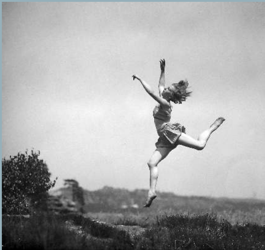
Χορεύτρια της σχολής της Mary Wigman, Ελβετία 1923