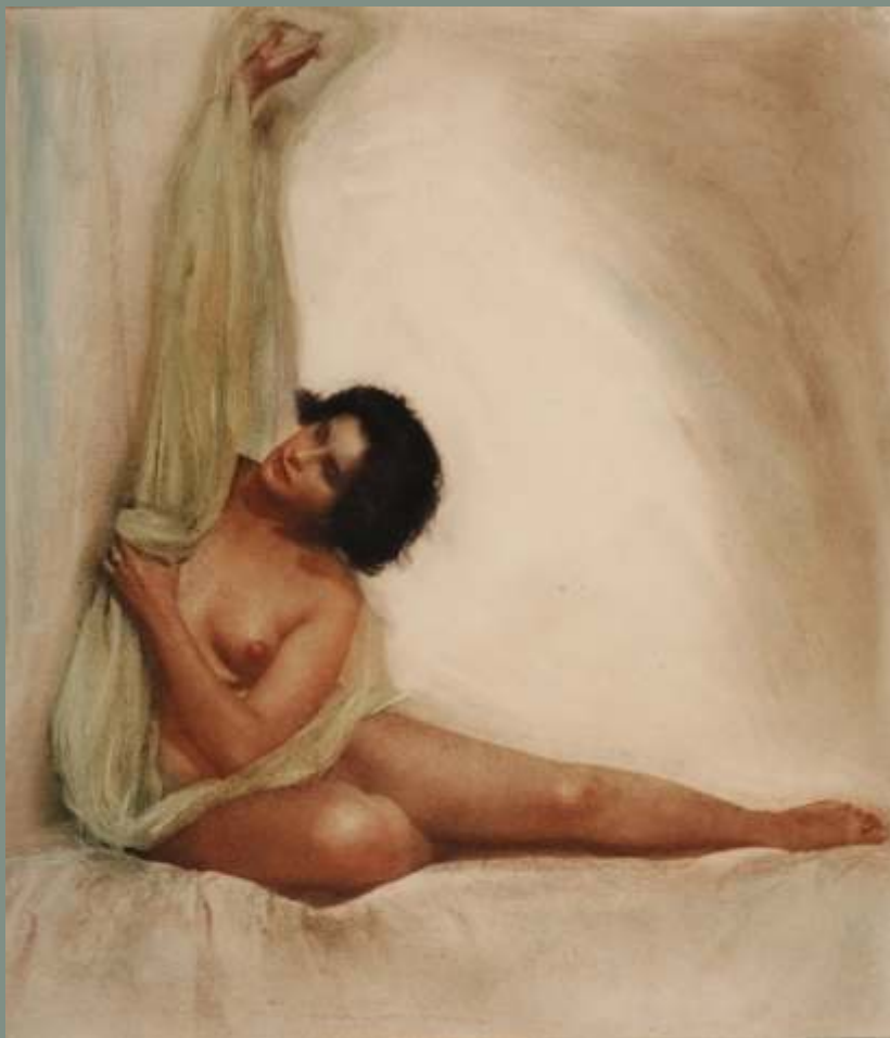
Σπυδές γυμνού στο στούντιο, Δρέσδη 1923