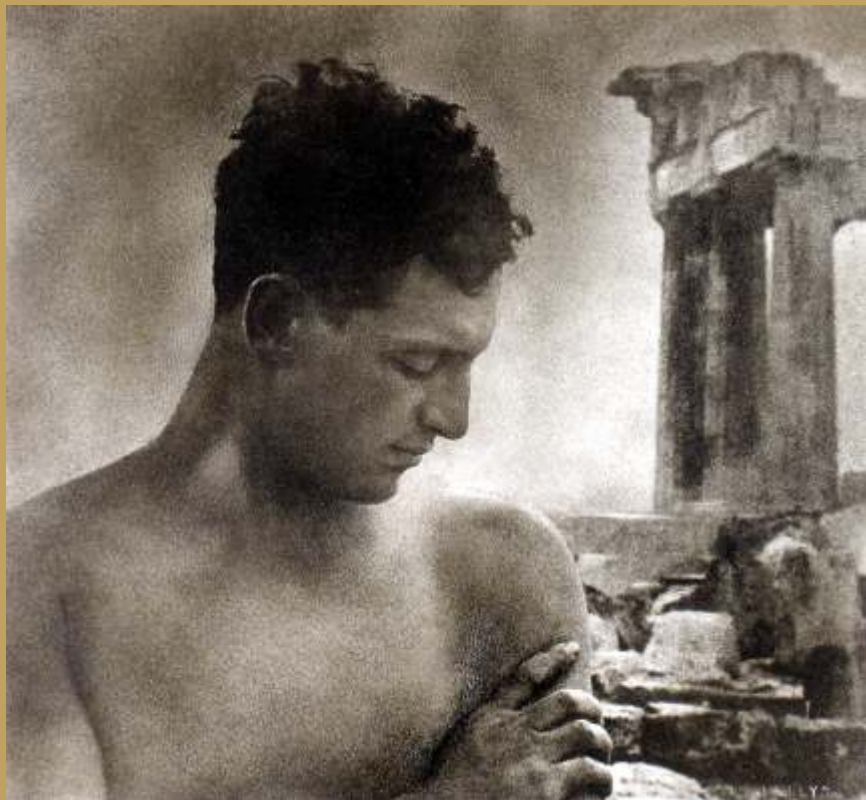
Ο Έλληνας Ολυμπιονίκης Δημήτρης Καραμπάτης στην Ακρόπολη, Αθήνα 1925