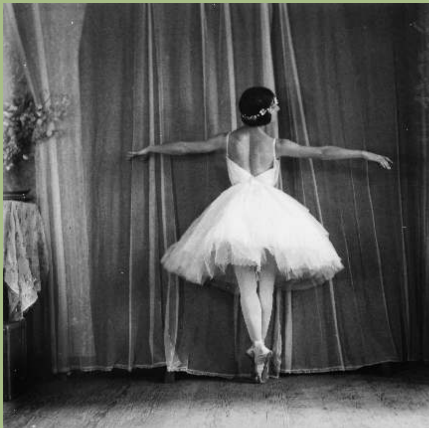
Η χορεύτρια Μονα Ραίνα στο στούντιο, Αθήνα 1927